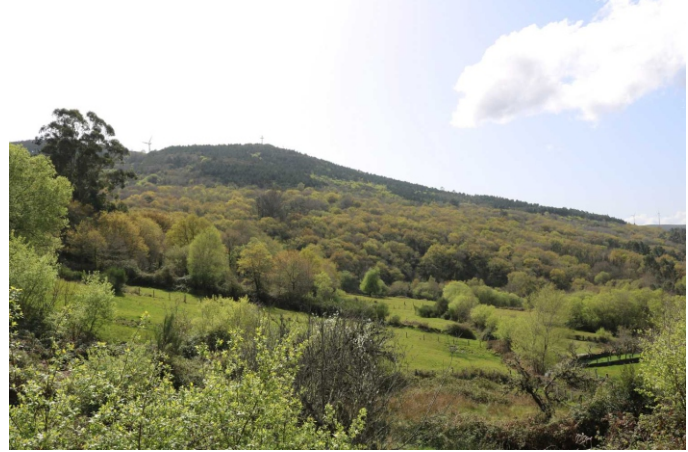
Carballeira na aba do Coto da Cruz