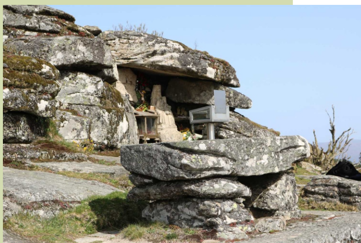
Cova da Virxe no Coto da Vella. En 1968 colocouse unha imaxe de pedra en recordo do lugar onde foi atopada a Virxe por primeira vez.