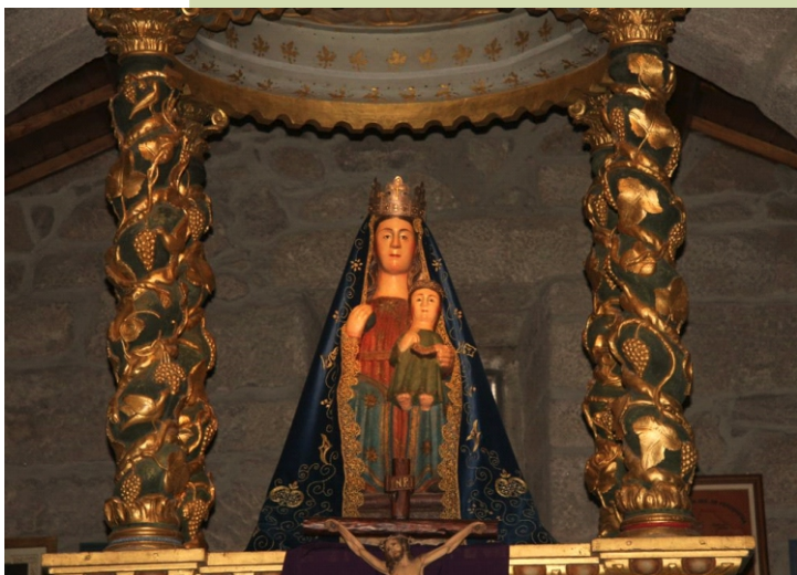
Imaxe da Virxe da Franqueira, en pedra policromada (século XIII).