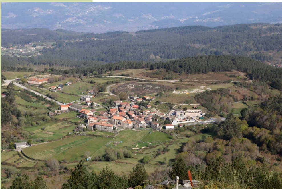
O lugar e o santuario da Franqueira desde o coto da Cruz

Todos os anos celébranse dúas romerías de fonda tradición, as Pascuíñas, na primavera, e a Natividade da Virxe, en setembro. Nas Pascuíñas reúnense a imaxes da Virxe de numerosas parroquias veciñas.