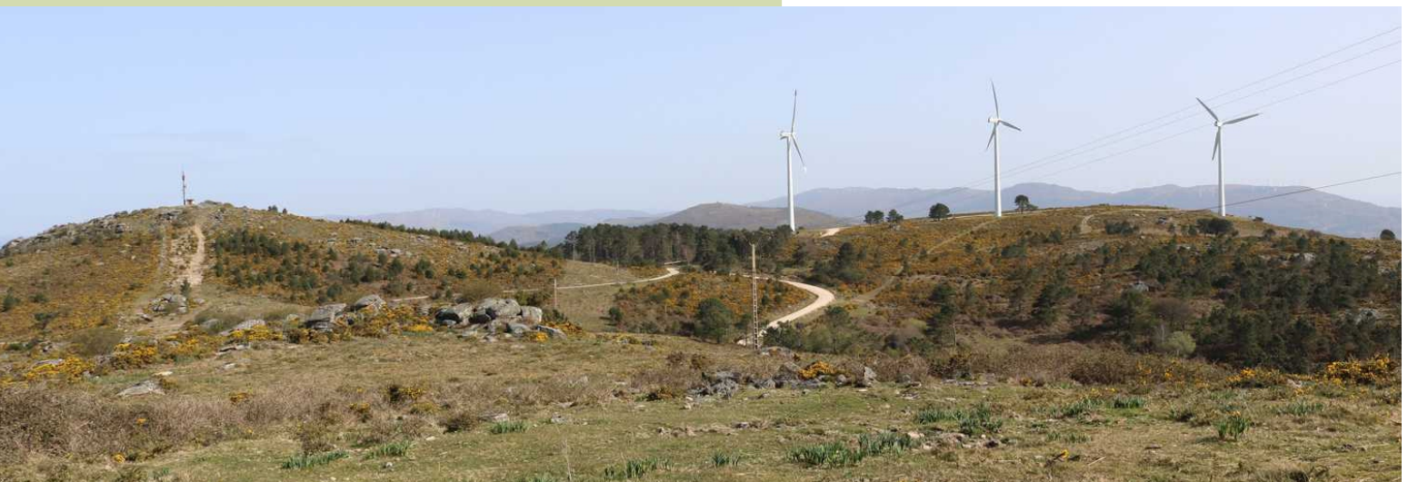
Alto da Paradanta e Coto Redondo

É Primavera, medran os días, suavízase a temperatura, esperta a natureza e o ambiente chama a ir cara aos montes onde os verdes novos e as flores das herbas e o mato -toxos, breixos, xestas e uces- transforman a paisaxe enchendo de cor o gris do inverno. A Paradanta véstese de amarelo nos cumes e de verdes de follas novas nas árbores dos vales baixos.