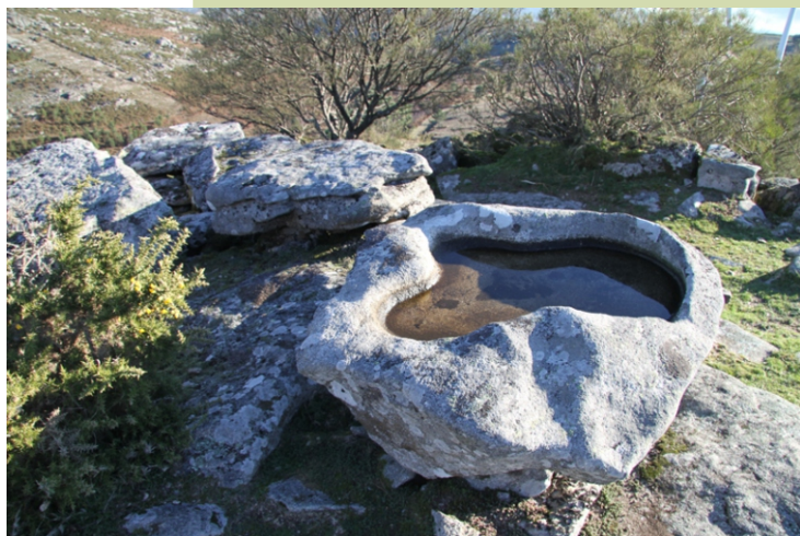
Pía no Alto da Paradanta