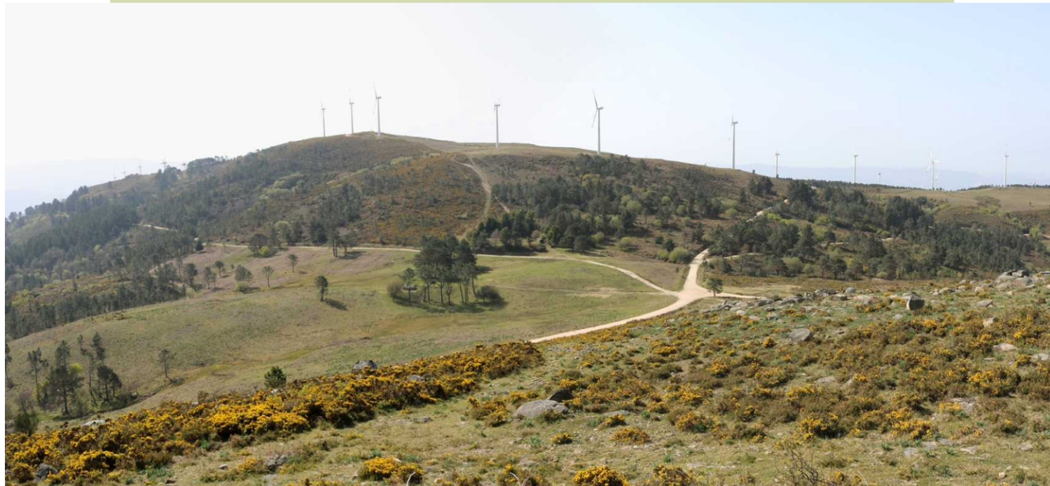
O Chan do Rei e o Chan do Marco desde o Coto da Vella